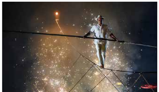
Compagnie « La Coupole ».

Spectacle « Les cinq éléments » par la compagnie « La Coupole » : à l'occasion de la fête de la Sainte Barbe, patronne des mineurs, le Musée-mine départemental a confié à « La Coupole », compagnie circassienne implantée sur le territoire carmausin, la création du spectacle « Les cinq éléments ». Le bois, le feu, la terre, le métal, l'eau... Le cheval, la lumière, l'homme, la musique, l'air... Cinq processus fondamentaux, cinq caractéristiques, cinq phases d'un même cycle pour évoquer, transcender, magnifier le métier de mineur de fond.