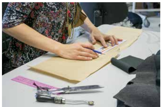
Atelier de création de costumes du Théâtre du Capitole, 2017.