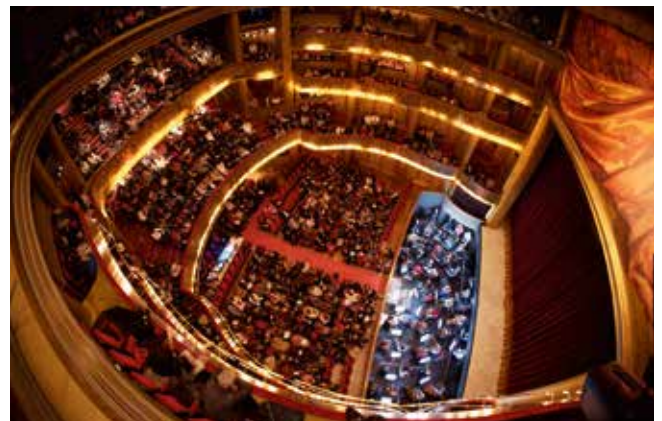
Le Théâtre du Capitole.