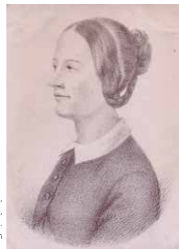
Portrait d'Eugénie, mine de plomb, Album Barthes. Collection Château-musée du Cayla.