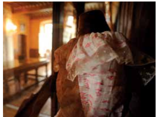
Château-musée du Cayla (Andillac), la salle à manger.