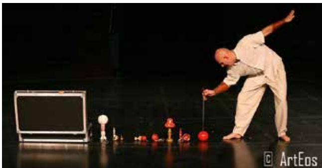
Spectacle « Un » d'Ezec Le Floc'h.

Le vernissage sera suivi, à 19 heures, d'un spectacle de cirque, « Un », d'Ezec Le Floc'h. Ezec Le Floc'h, vibrant d'un talent généreux, joue de son bilboquet, en exploite les possibilités inattendues avec créativité, jusqu'à flirter avec le surréalisme, voire l'absurde... Car l'un des premiers talents de ce garçon est une incroyable présence au public, chaleureuse, vibratile, malicieuse. On a tout de suite envie de le suivre dans son jeu de fantaisie et aussi d'admirer le passage avec les boules en feu !