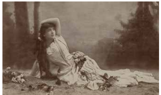
Emma Calvé en Ophélie dans Hamlet.