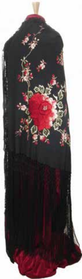
Grand châle. Costume de scène pour Carmen, 1892-1904. Musée de Millau