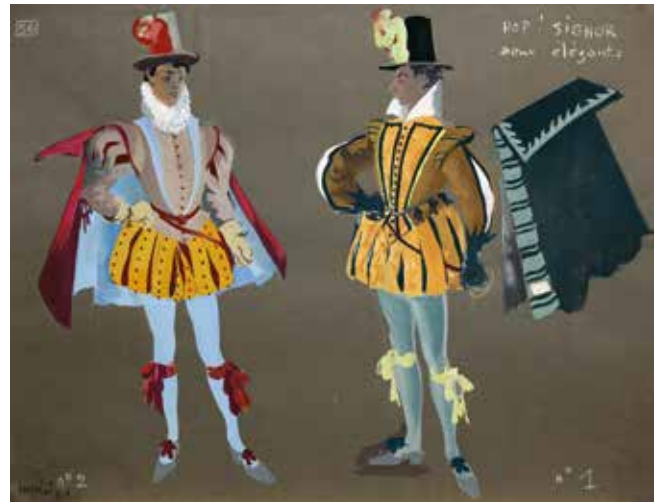
Deux élégants, dessin à la gouache sur papier noir, Maurice Mélat, 1961. Musée Goya (Castres).