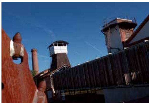
Le Musée-mine départemental (Cagnac-les-mines).

Témoin privilégié de cette épopée qui a duré sept siècles, faite de découvertes, de progrès techniques, de luttes sociales où Jean Jaurès occupe une place centrale, le musée vous offre, à travers son parcours permanent et ses expositions temporaires, des instantanés de vie et d'histoires de ce riche passé industriel.