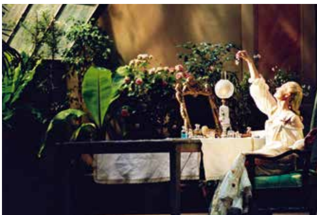
Mignon , d'Ambroise Thomas, Théâtre du Capitole, 2001. Costumes de Gérard Audier.