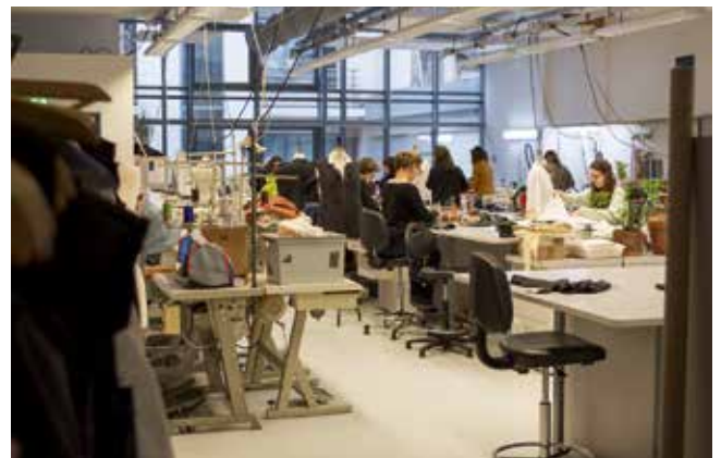
Atelier de création de costumes du Théâtre du Capitole, 2017.