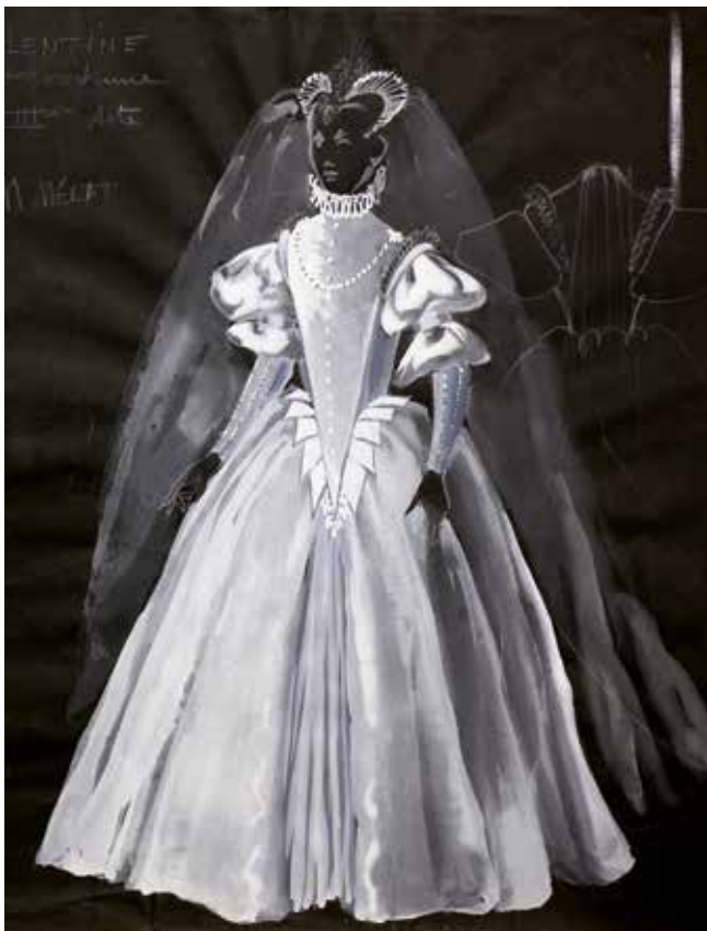
Costume les Huguenots (costume féminin), dessin à la gouache sur papier noir avec collage de tissus, Maurice Mélat, 1972. Musée Goya (Castres).

Cette exposition retrace l'ambiance autour du théâtre et de l'opéra ainsi que des arts de la rue dans le Tarn et en région aux XIX e et XX e siècles grâce à de nombreux prêts de costumes, décors et accessoires par le musée Goya de Castres, le musée Urbain Cabrol de Villefranche de Rouergue, le Théâtre du Capitole de Toulouse et des collectionneurs particuliers. Tous les métiers du spectacle (décorateur, dessinateur, costumier, brodeur, plumassier...) sont présentés.