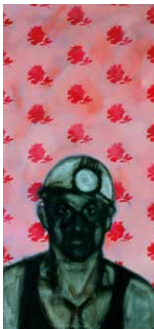
Colin Painter, « Gueule Noire 1 ».