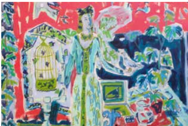
Cavaillès, La Magicienne , (détail de maquette).

Toutes ces pièces racontent une histoire jouée où figurent des personnages en représentation, magnifiés par une vision poétique ou symbolique du réel. Une vision positive du théâtre de la vie.