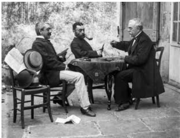
Joueurs de carte (détail), photographie Arthur Batut, fin XIX e . Coll. Archives départementales du Tarn/Espace photographique Arthur Batut.

L'Espace photographique Arthur Batut présente pour cette exposition une sélection extraite de fonds d'amateurs photographes qui ont vécu dans le Tarn et ses départements limitrophes au tournant du XIX e et du XX e siècles : G. Ancely, A. Batut, C. Langlade, E. Trutat, etc.