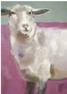
Peinture de Pierre Poli.