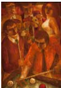
Cartes et billards - FB.

Le musée regroupe les œuvres d'artistes de l'exil : Francisco Bajen et Martine Vega. Inscrites dans les courants du XX e siècle, ces peintures sont présentées sous différentes thématiques. Cette année, « Les jeux et les loisirs » sont exposés.