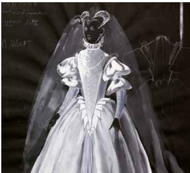
Costume les Huguenots (costume féminin), dessin à la gouache sur papier noir avec collage de tissu, Maurice Mélat, 1972. Musée Goya (Castres).

Cette exposition retrace l'ambiance autour du théâtre et de l'opéra ainsi que des arts de la rue dans le Tarn et en région aux XIX e et XX e siècles grâce à de nombreux prêts de costumes, décors et accessoires par les musées Goya de Castres, Urbain Cabrol de Villefranche de Rouergue et de collectionneurs particuliers. Tous les métiers du spectacle (décorateur, dessinateur, costumier, brodeur, plumassier...) sont présentés. Deux cantatrices régionales, Emma Calvé et Henriette Barette, sont mises à l'honneur.