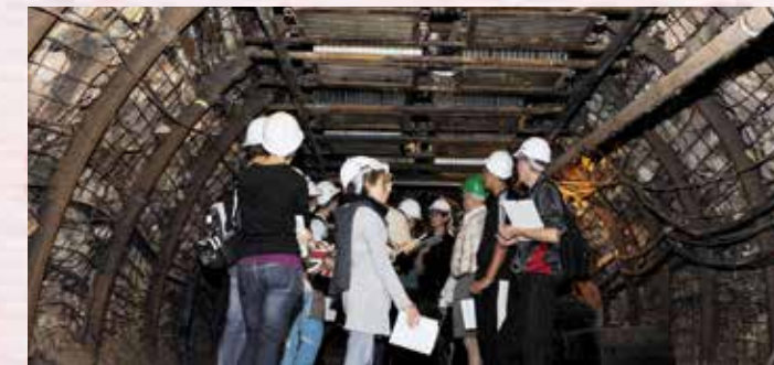
Accueil de collégiens au Musée-mine départemental.

> Tout public : Ateliers créatifs (filage créatif, couleurs, Batik...).